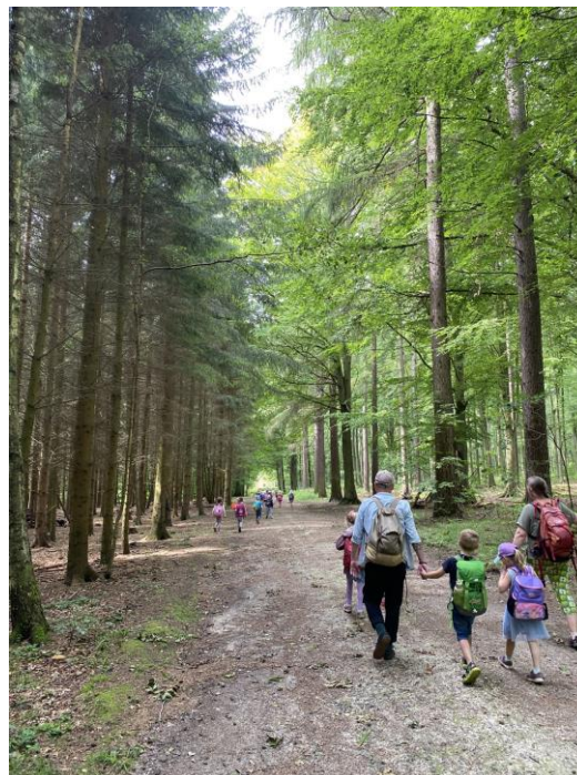
” På vej til Vestre Hus ”

Børnene danner stærke relationer og de oplever en tryghed i, at alle skal det samme, når børnehavetiden nærmer sig sin afslutning.